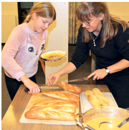
Børn og ledere hjælper hinanden, når der bliver serveret.

- Det er vigtigt, at du tør være dig selv over for børnene. De kan mærke, hvis du ikke er det.