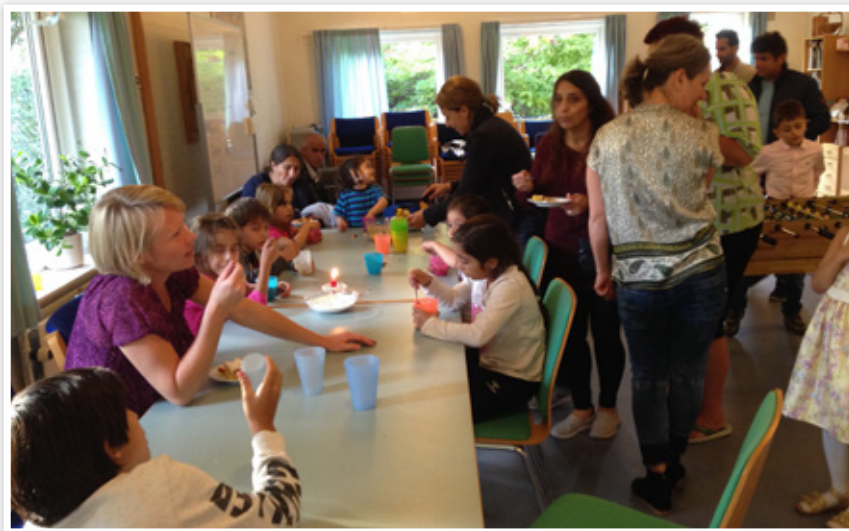
Det kreative værested er indstillet til årets kirkelige initiativpris.