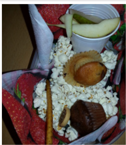
Der bliver gjort ekstra meget ud af bordpyntningen, når der er årsfest

I Stjerneglimt vil alle være med i børnerådet