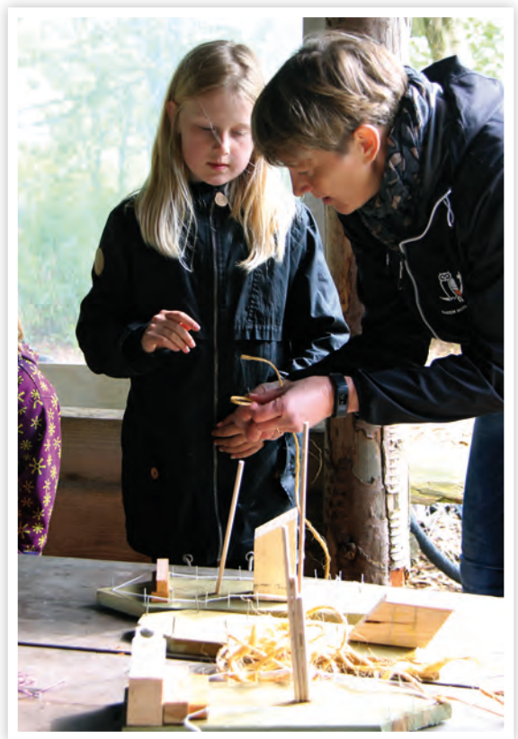
Før bådene kan sejle, skal børnene lige have bundet en snor i, så de kan få fat i båden igen.

begejstres, så det forsøger vi på i bibelfortællingen ved at inddrage dem og i aktiviteterne.